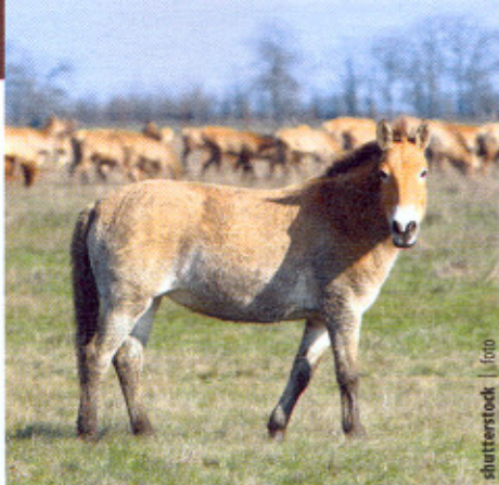
Divoký tarpan je predkom hucula

To si uvedomujú koniari vo viacerých okolitých krajinách. V Poľsku, Česku, Maďarsku i u nás